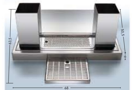
Thekeneinbauvorrichtung 8000 Art.-Nr. 70.879