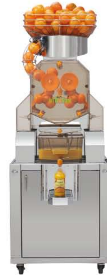
Citrocasa 8000 XB mit Juice-Tank Art.-Nr. 80.002 Stainless Steel Cabinet 8000 Art.-Nr. 70.000