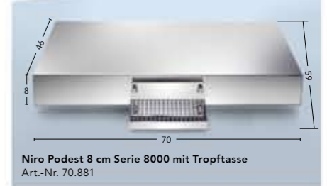
Niro Podest 8 cm Serie 8000 mit Tropfasse Art.-Nr. 70.881