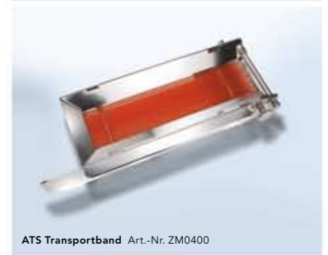
ATS Transportband Art.-Nr. ZM0400