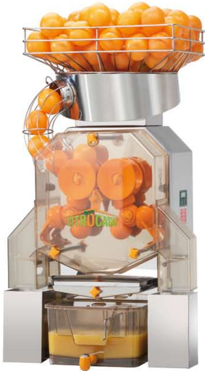
Citrocasa 8000 XB mit Juice-Tank Art.-Nr. 80.002