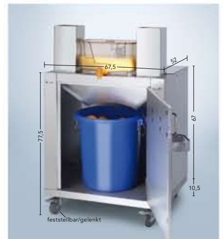
Stainless Steel Cabinet 8000 Art.-Nr. 70.000