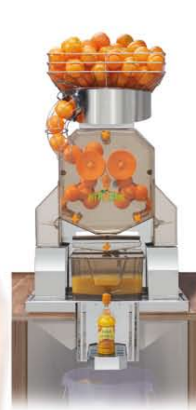
Citrocasa 8000 XB mit Juice-Tank Art.-Nr. 80.002 Thekeneinbauvorrichtung mit Tropfasse Art.-Nr. 70.879