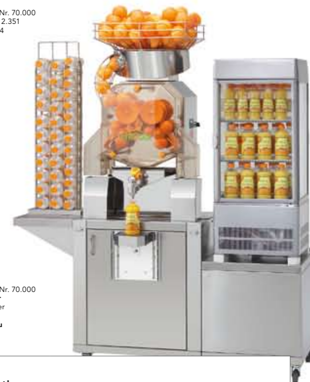
Citrocasa 8000 SB Art.-Nr. 90.002 Stainless Steel Cabinet 8000 Art.-Nr. 70.000 Flaschenspender ½ Liter & ⅓ Liter (2 Schächte ½ Liter, 1 Schacht ⅓ Liter bzw. ¼ Liter) Art.-Nr. 2.365 Kompakt-Kühleinheit mit Unterbau Art.-Nr. 50.129, Art.-Nr. 232.037