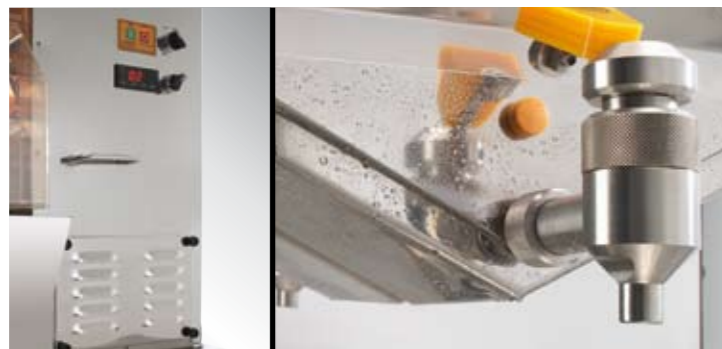
Hochleistungsdurchflussskühlung Art.-Nr. 1.301

Durch das Hochleistungskühlungssystem in der CITROCASA 8000 SBC servieren Sie Ihren Gästen wohltemperierten Fruchtsaft in absolut erstklassiger Güte.