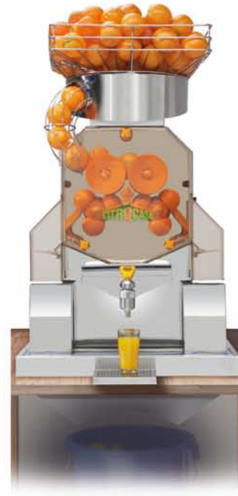
Citrocasa 8000 SB Art.-Nr. 90.002 Thekeneinbauvorrichtung 8000 mit Tropftrasse Art.-Nr. 70.879

Die rotierende Edelstahltransportplatte im Fruchtkorb sorgt dafür, dass die Beschickung der Presse perfekt und ohne Unterbrechung gewährleistet ist.