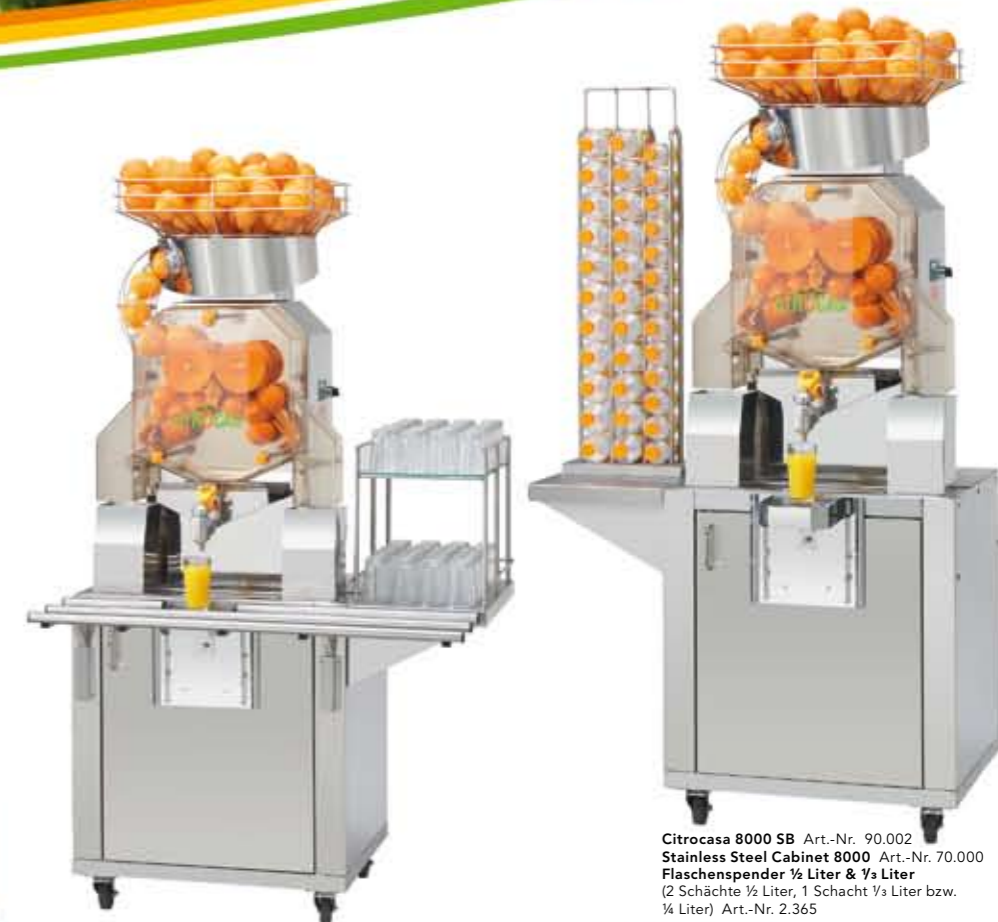
Citrocasa 8000 SB Art.-Nr. 90.002 Stainless Steel Cabinet 8000 Art.-Nr. 70.000 Gläserpresenter 2 Etagen Art.-Nr. 2.351 Sicherheitsglasplatte Art.-Nr. 2.354 Arbeitsplatte Art.-Nr. 2.353 Tableau-Ablage Art.-Nr. 2.359