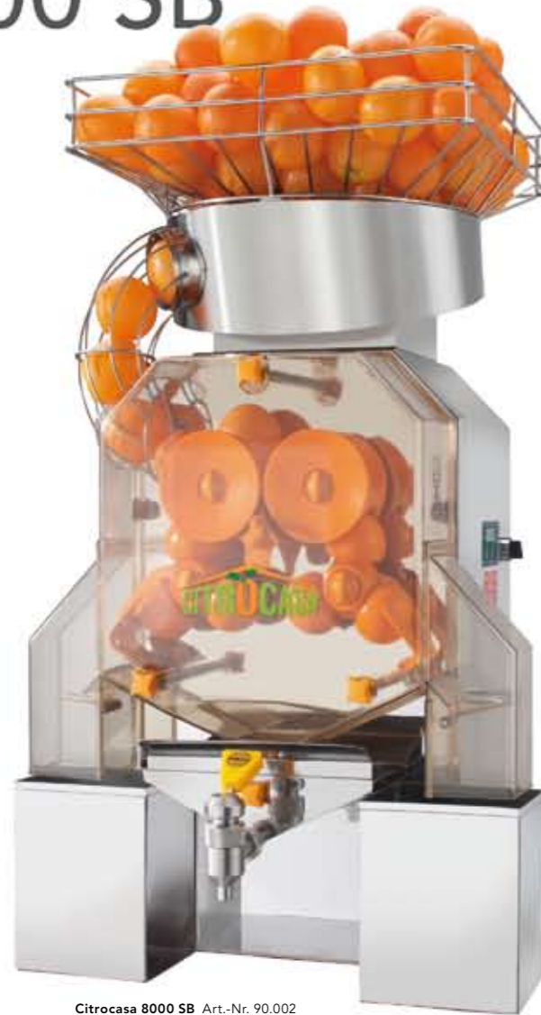
Citrocasa 8000 SB Art.-Nr. 90.002

Mit der CITROCASA 8000 SB kombinieren Sie höchste Leistung mit feinstem Fruchtgenuss.