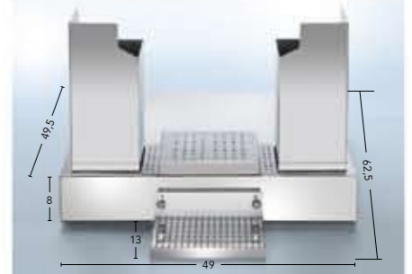
Thekeneinbauvorrichtung 6000/7000 Art.-Nr. 70.878