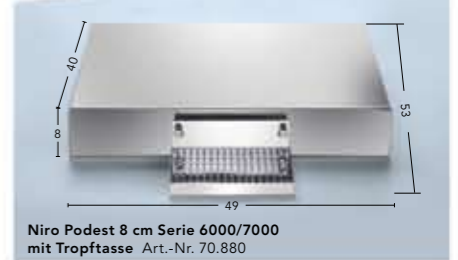
Niro Podest 8 cm Serie 6000/7000 mit Tropfasse Art.-Nr. 70.880