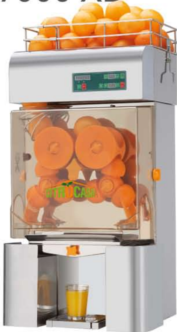
Citrocasa 7000 XB Art.-Nr. 80.501

Auf allen Bühnen ein Star: Die CITROCASA 7000 XB glänzt nicht nur durch ihre edle Stahloptik.