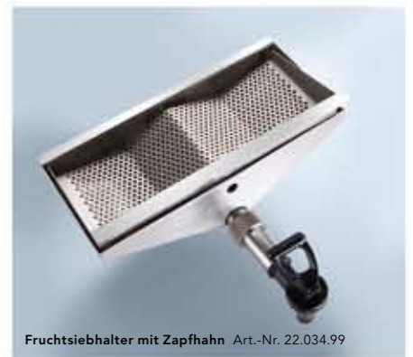
Fruchtsiebhalter mit Zapfhahn Art.-Nr. 22.034.99