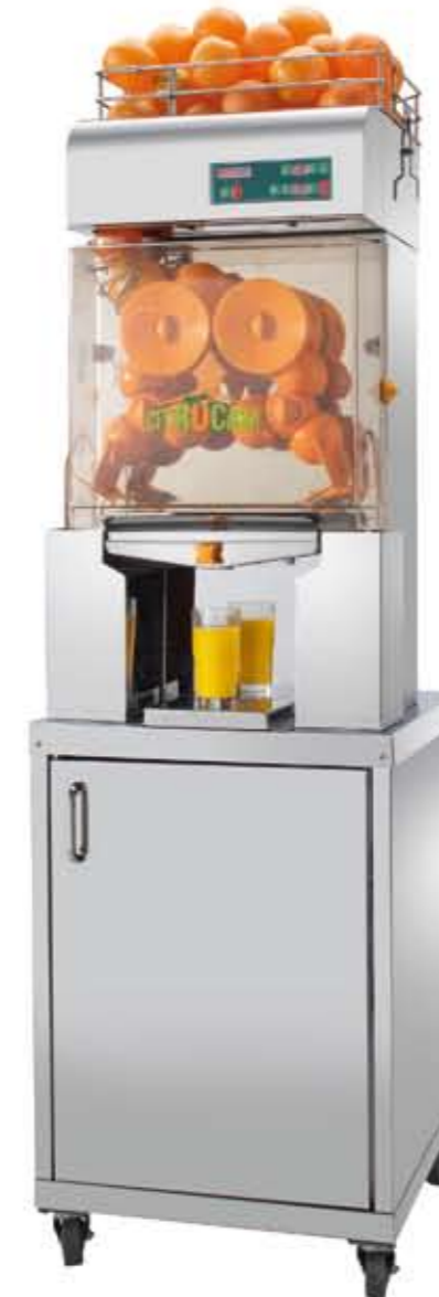
Citrocasa 7000 XB Art.-Nr. 80.501 Stainless Steel Cabinet 6000/7000 Art.-Nr. 70.100