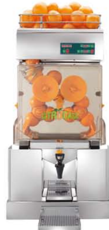
Citrocasa 7000 XB Art.-Nr. 80.501 Niro Podest 8 cm Serie 6000/7000 mit Tropfasse Art.-Nr. 70.880 Fruchtsiebhalter mit Zapfhahn Art.-Nr. 22.034.99

Die 7000 XB ist genau das richtige Gerät, wenn Sie Ihren Gästen schnell, flexibel und problemlos edelsten Fruchtsaftgenuss servieren wollen.