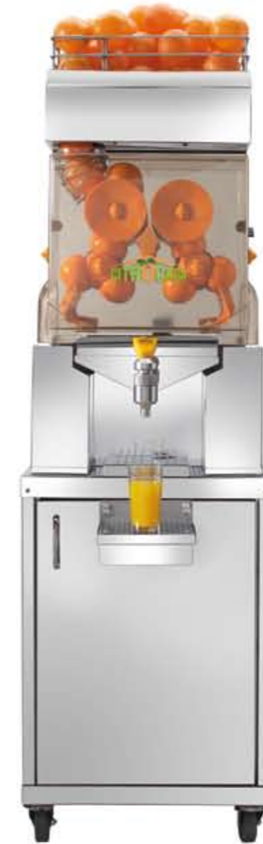
Citrocasa 7000 SB Art.-Nr. 90.101 Stainless Steel Cabinet 6000/7000 Art.-Nr. 70.100