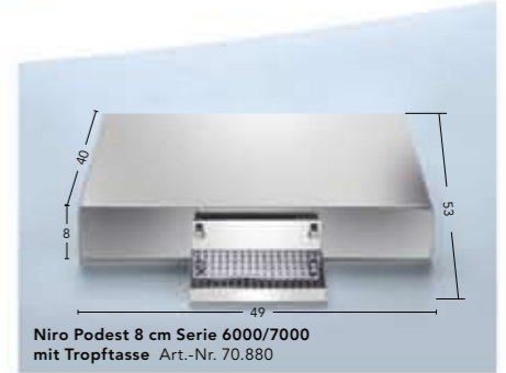
Niro Podest 8 cm Serie 6000/7000 mit Tropftrasse Art.-Nr. 70.880