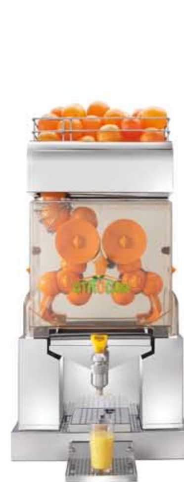
Citrocasa 7000 SB Art.-Nr. 90.101 Thekeneinbauvorrichtung 6000/7000 Art.-Nr. 70.878