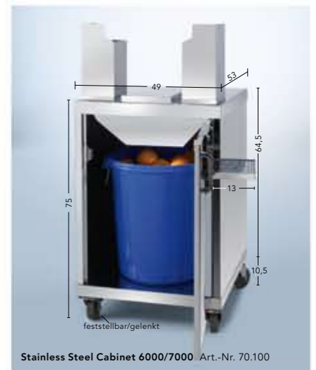
Stainless Steel Cabinet 6000/7000 Art.-Nr. 70.100