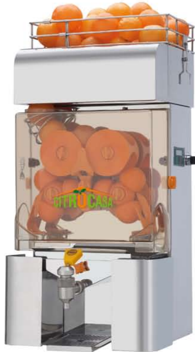
Citrocasa 7000 SB Art.-Nr. 90.101