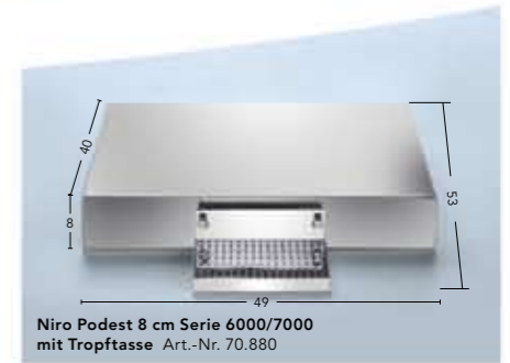
Niro Podest 8 cm Serie 6000/7000 mit Tropfasse Art.-Nr. 70.880