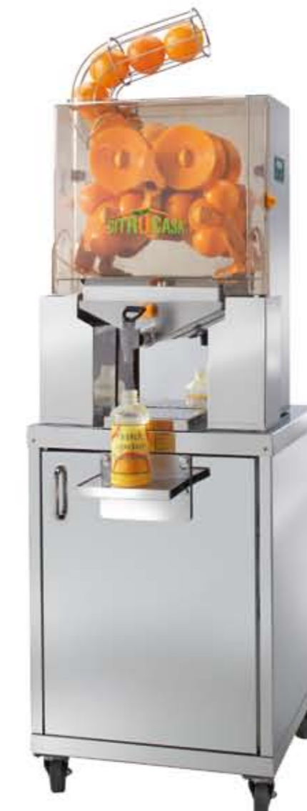
Citrocasa 6000 XB Art.-Nr. 80.101 Stainless Steel Cabinet 6000/7000 Art.-Nr. 70.100 Fruchtsiebhalter mit Zapfhahn Art.-Nr. 22.034.99