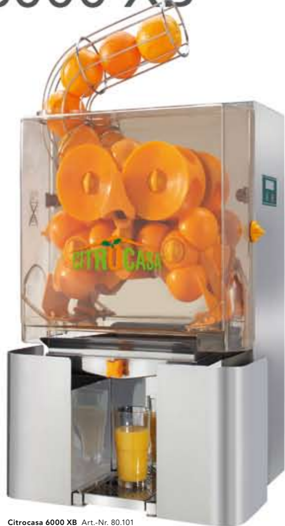
Citrocasa 6000 XB Art.-Nr. 80.101

Die CITROCASA 6000 als Einstiegsmodell in eine neue Dimension des guten Geschmacks zu bezeichnen, wäre zu kurz gegriffen.