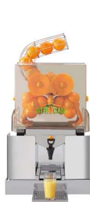
Citrocasa 6000 XB Art.-Nr. 80.101 Niro Podest 8 cm Serie 6000/7000 mit Tropfasse Art.-Nr. 70.880 Fruchtsiebhalter mit Zapfhahn Art.-Nr. 22.034.99

Mit einer Leistung von ca. 1,6 Liter Saft pro Minute, mit ihrer kompakten Größe und eleganten Erscheinung wird die CITROCASA 6000 XB Ihnen und Ihren Kunden bzw. Gästen eine Menge Freude bereiten.