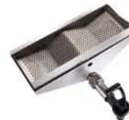
Fruchtsiebhalter mit Zapfhahn Art.-Nr. 22.034.99